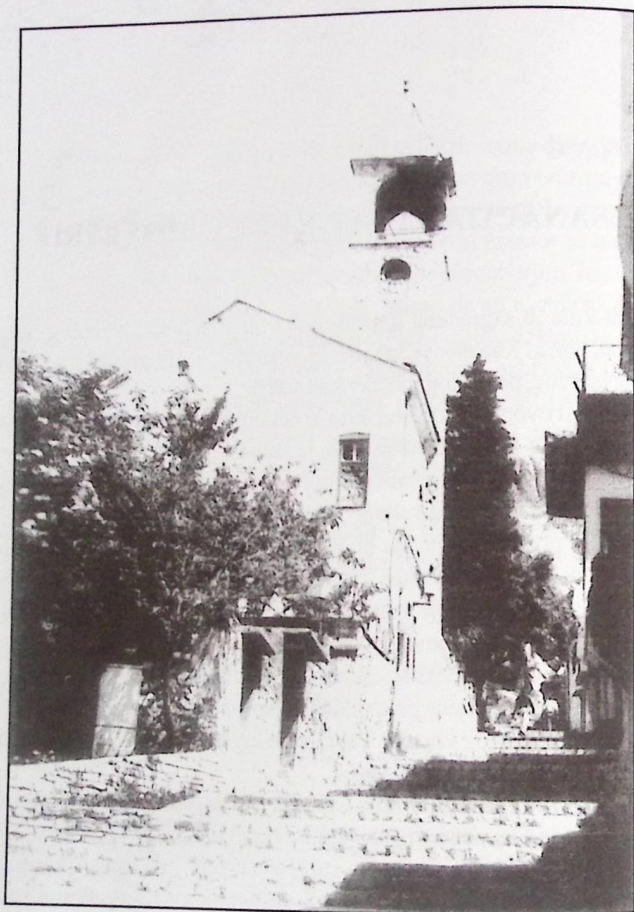
Razaranje Sahat-kule u ratnom periodu

U svojoj historiji sat na Sahat-kuli otkucavao je vrijeme po "alaturka" i "alafranka" sistemu.