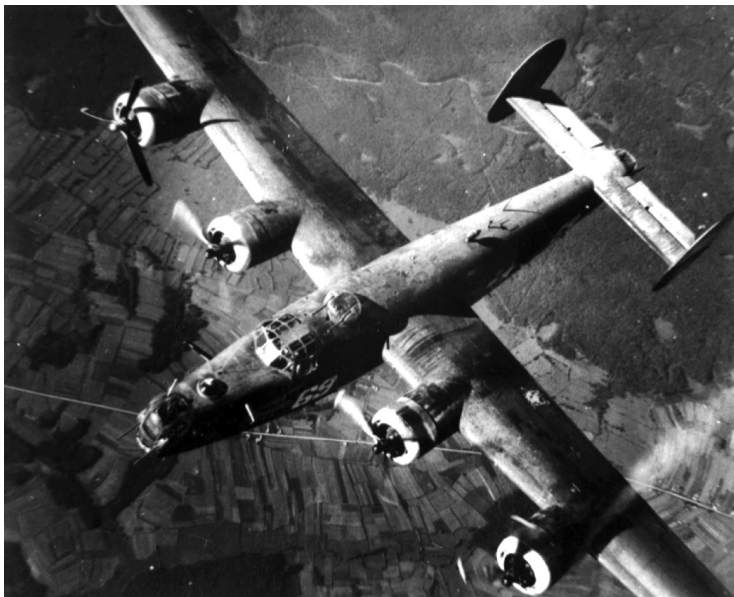
Slika 5. Bombarder Liberator B-24 iz 451. bombarderske grupe nad Minhenom. Drugi, potpuno isti tip aviona, iz ove jedinice srušen je nad Mostarom 17. aprila 1944. Na slici se vide mitraljeske kupole u nosu, na vrhu i u repu aviona. U toku Drugog svjetskog rata napravljeno je 18.500 ovakvih bombardera.

U istoj visini između američkih aviona pojavili su se crni oblačići dima koji nastaju prilikom eksploziranja protivavionskih granata. Da bi izbjegli gelere, piloti svih aviona su dodali gas i krenuli u penjanje pod najvećim mogućim uglom, ali bombarder Honey Chile nije imao sreće. Avion je pogođen direktno u rep koji je otpao skupa sa repnom kupolom u kojoj se nalazio mitraljezac, narednik Andrew Tittle. Zvuči nevjerovatno, ali narednik je uspio iskočiti iz padajuće kupole i otvoriti svoj padobran. 49 Drugi put je avion pogođen u rolo-vrata za ispuštanje bombi. Bombarder je počeo padati udesno od ostatka eskadrile. Osim Andrewa, uspjeli su iskočiti i mitraljesci u gornjoj i donjoj kupoli, narednici Gordon Butts i Everett Sanborn. Poslije uspješnog prizemljenja, Nijemci su ih zarobili i ostatak rata su proveli u zarobljeničkom logoru za britanske i američke avijatičare Stalag Luft III u blizini današnjeg gradića Žagana u jugozapadnoj Poljskoj. Posade drugih aviona su vidjele da