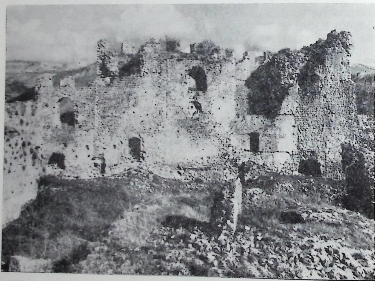
Sl. 2. Istočni izgled Blagaja na Buni, unutrašnji izgled