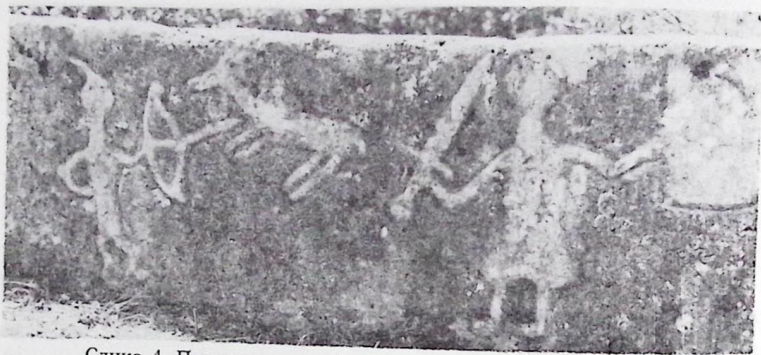
Слика 4. Приказ лова на јелена на сандуку у Драгичини

Сцена лова је омиљена тема рељефа стећака. Обично и најчешће је то лов на јелена, али се понекад јавља и сцена лова на вепра и врло ријетка сцена лова на медвједа. У највећем броју сцена лова на јелена ловац је на коњу, са копљем или мачем, изнимно са луком, често уз учешће паса и соколова. У неким од тих сцена учествују по двојица коњаника, а има и сцена са једним коњаником и једним ловцем пјешаком са луком. Постоје и другачије варијанте лова на јелена. Наш случај из Хамзића је доста честа појава, када имамо у виду ловца коњаника који, уз учешће пса, копљем напада на јелена. Рјеђи је, међутим, случај када у лову учествује и ловац пјешак, с мачем, какав се појављује у Хамзићима. Као и на стећцима, и та сцена је доста динамична. Извјесне сличности с том има већ споменута сцена лова на сјемењаку у Черину (сада у Сарајеву), с тим што у черинској нема коњаника, а има сокола, те што ловац пјешак не држи мач, него лук, а онда што у лову учествује само један пас.