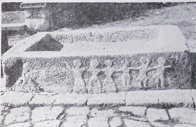
Слика 1. Представа кола на јужној бочној страни корита у Хамзићима (види се и повијена лозица на водоравној страни корита)

На садашњој јужној вертикалној (бочној) страни представљено је коло са 6 пластичних фигура — 3 мушкарца и 3 жене — које се у висини рамена држе рукама у водоравном положају. Жене имају дугачке хаљине утегнуте у пасу, а мушкарци су у хлачама приљубљеним уз ноге и хаљенима који допиру до изнад кољена. Код мушкараца су стопала окренута улијево. Према положају ногу мушкараца види се да коло креће улијево, гледајући од корита. Коловођа је мушкарац који је своју слободну руку подбочио, а зачелна фигура је жена која је своју слободну руку високо подигла (слика 1).