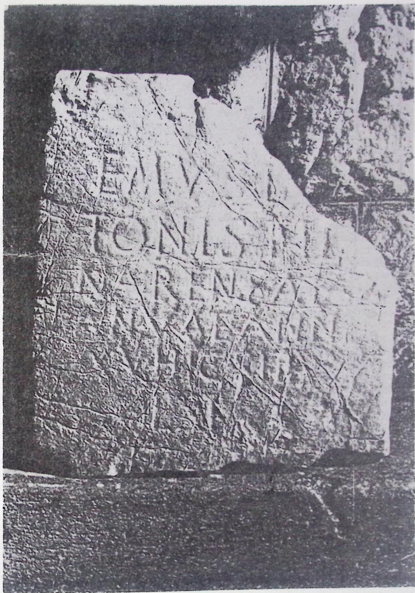
Rimski epigrafski spomenik, Kazanci kod Gacka